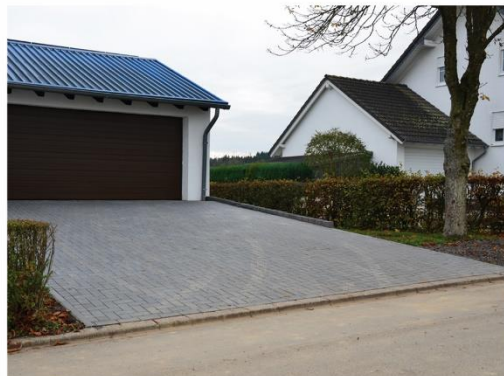
Tiefbau und Außenanlagen

54426 Malborn ▪ Tel. 06504/426 ▪ Fax 8703 54411 Hermeskeil ▪ Tel. 06503/1855 ▪ info@ott-bau-malborn.de